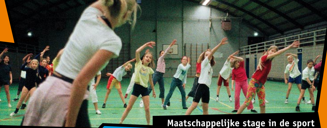
Maatschappelijke stage in de sport